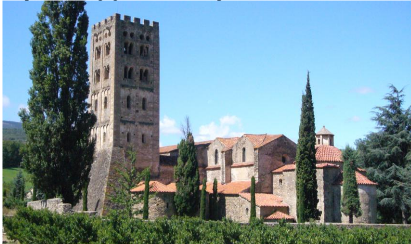
Figure 2: Abbaye Saint-Michel de Cuxa (Xe-XIe siècles)

Une curiosité également nouvelle s'attache au décor. À l'extérieur, des lignes horizontales de festons sous corniche et des bandes verticales en faible saillie (lésènes) articulent les masses de l'architecture. C'est le cas à San Paragorio de Noli et à San Abbondio de Côme, au milieu du XIe siècle, où se remarque aussi le soin apporté au petit appareil. Ce phénomène s'observe aussi de part et d'autre des Pyrénées, à Sainte-Cécile de Montserrat ou à Saint-Martin du Canigou, dans le Languedoc, et dans la vallée du Rhône jusqu'en Bourgogne (Tournus). À l'intérieur, sur un plan relativement simple, les piles quadrangulaires s'ornent de ressauts, des colonnes ou pilastres engagés articulent la pile et scandent les murs en travées.