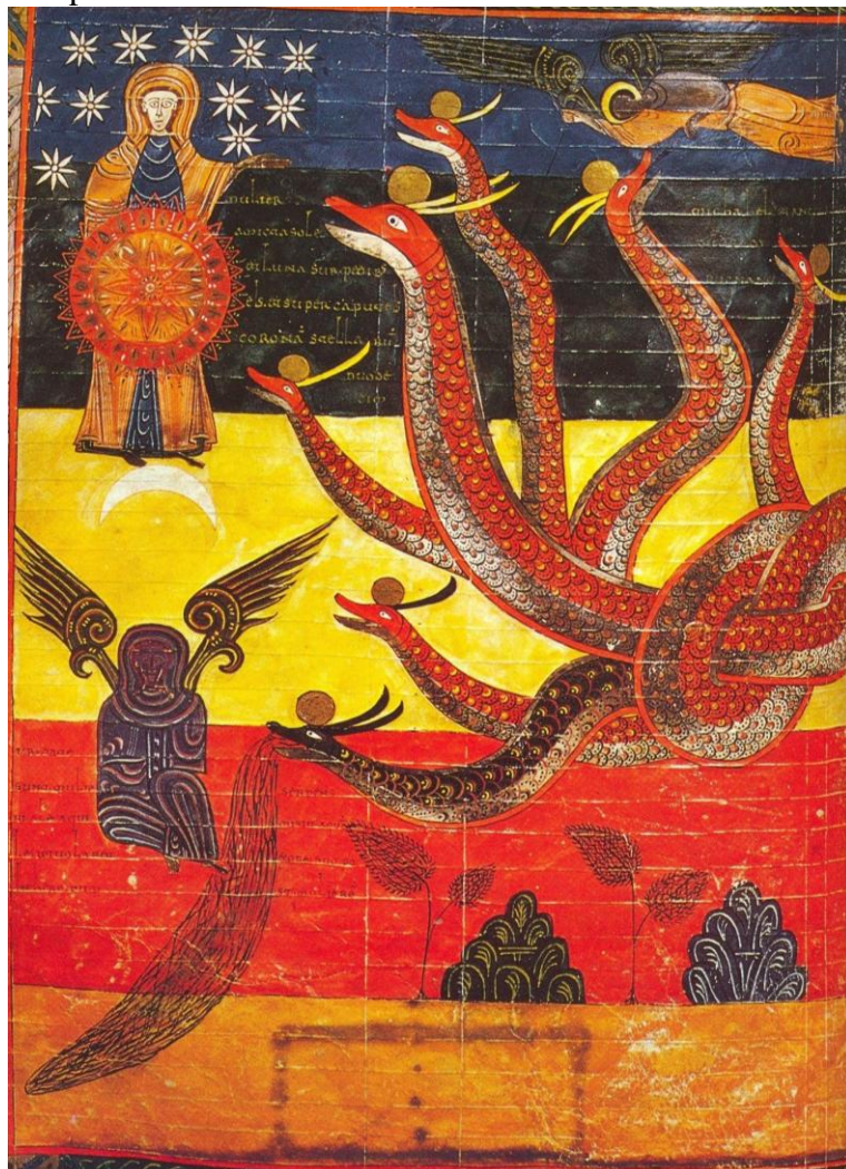
Figure 5: Beatus de Liebana, Commentaire de l'Apocalypse, f° 186 v

Aux origines de l'art roman, la statue de sainte Foy du trésor de Conques tient une place particulière : l'histoire débute sous Charles le Chauve avec le rapt des reliques de la jeune martyre d'Agen par un moine de Conques. La tête d'or de la statue est une oeuvre antique en remploi ; le corps de bois et quelques fragments d'or de son vêtement remontent à l'époque carolingienne ; mais le trône, la couronne, les orfrois de filigranes enrichis de pierreries de toutes sortes et de toutes origines sont des enrichissements postérieurs au miracle, survenu en 985, de Guibert, l'« Illuminé » qui avait retrouvé vue grâce à l'intercession de la sainte. Prototype des « majestés » romanes, elle est aussi symbolique dans l'hétérogénéité des éléments qui la composent, de la genèse complexe de l'art roman.