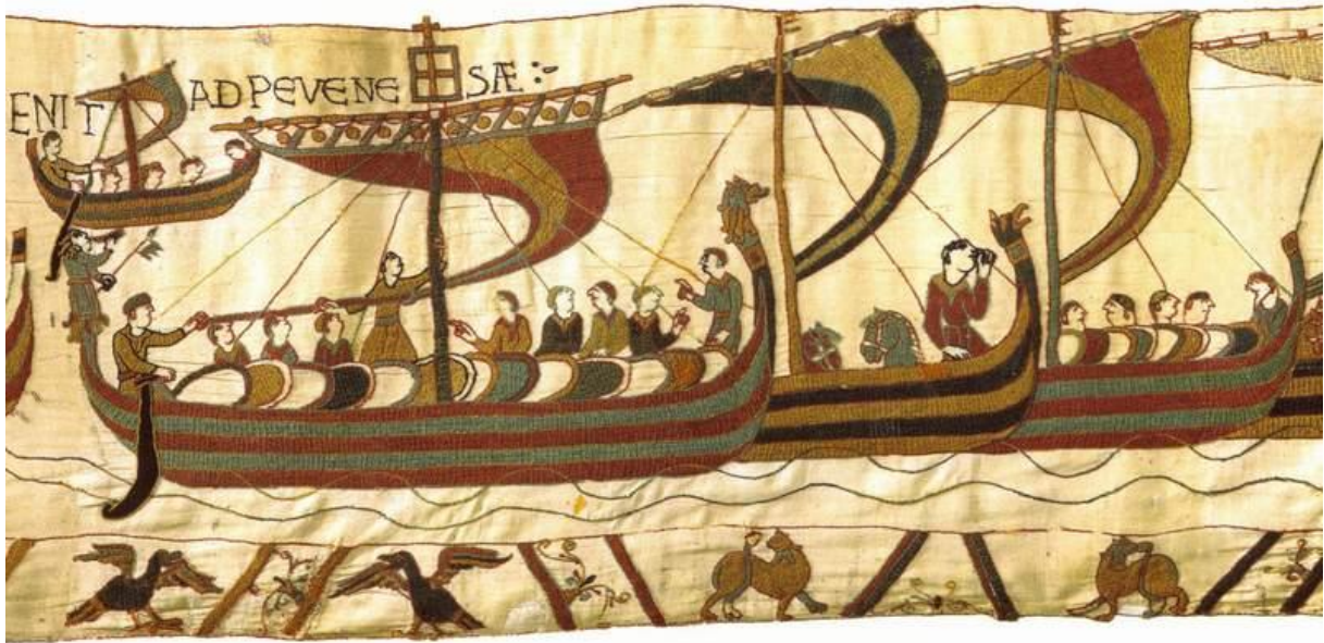
Figure 4: Scène de la broderie de Bayeux, après 1066

Aux origines de l'art roman, la statue de sainte Foy du trésor de Conques tient une place particulière : l'histoire débute sous Charles le Chauve avec le rapt des reliques de la jeune martyre d'Agen par un moine de Conques. La tête d'or de la statue est une oeuvre antique en remploi ; le corps de bois et quelques fragments d'or de son vêtement remontent à l'époque carolingienne ; mais le trône, la couronne, les orfrois de filigranes enrichis de pierreries de toutes sortes et de toutes origines sont des enrichissements postérieurs au miracle, survenu en 985, de Guibert, l'« Illuminé » qui avait retrouvé vue grâce à l'intercession de la sainte. Prototype des « majestés » romanes, elle est aussi symbolique dans l'hétérogénéité des éléments qui la composent, de la genèse complexe de l'art roman.