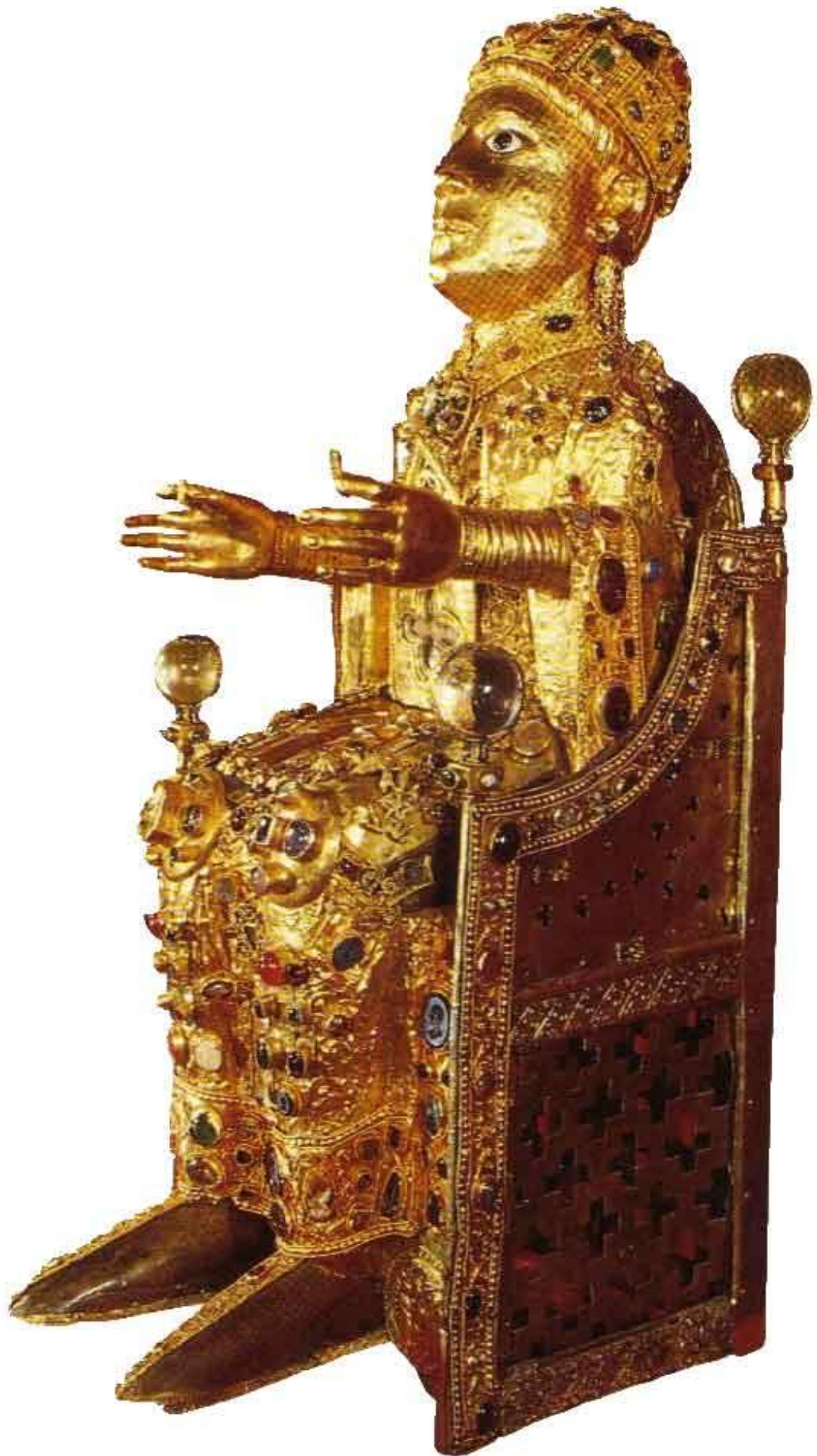
Figure 6: Majesté de sainte Foy. Or, argent, pierres précieuses, émaux, intailles, camées et adjonctions diverses, Conques, trésor de l'abbaye