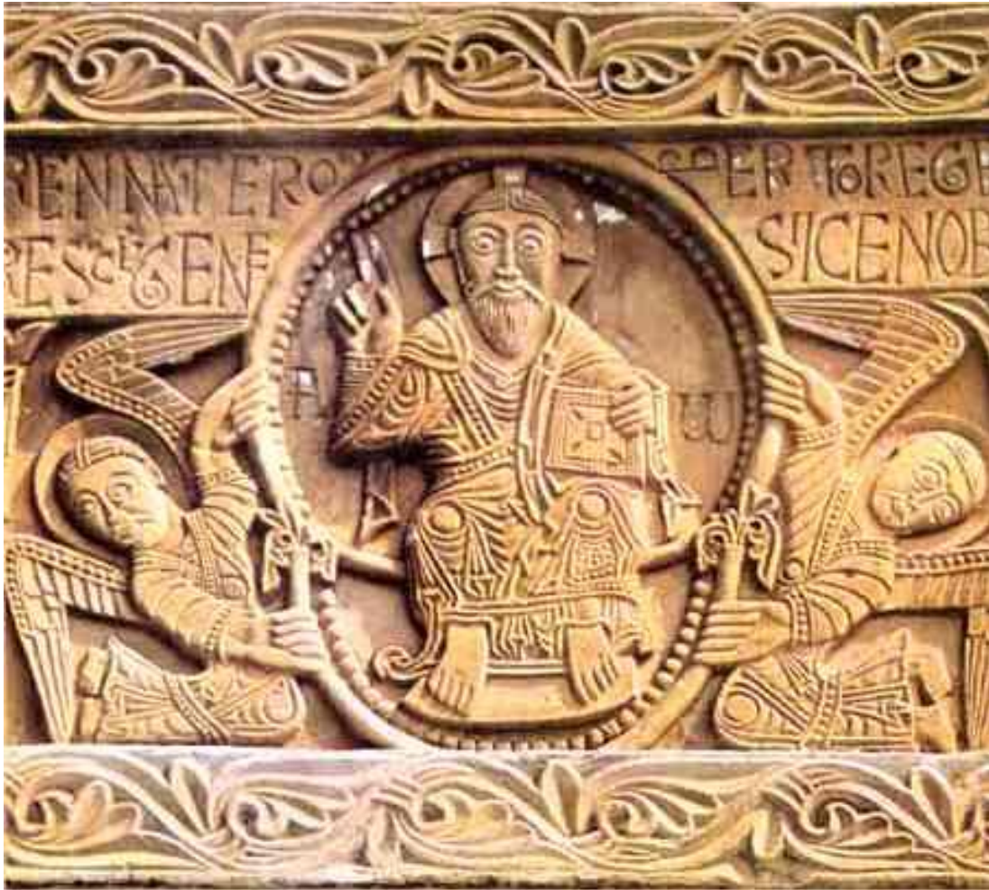
Figure 3: Linteau du portail de l'église Saint-Genis-des-Fontaines (1020-1021)

Des mutations tout aussi fondamentales s'observent dans la peinture et les arts précieux. Dans les royaumes chrétiens d'Espagne du Nord, les peintres « mozarabes » des deux bibles datées de 920 et de 960 de la cathédrale et du collège San Isidoro de Leôn, et ceux qui multiplient les versions illustrées du Commentaire de l'Apocalypse de Beatus de Liebana, abandonnent l'illusionnisme pour la force visionnaire, les aplats de couleurs vives et la ligne décorative des arts de l'islam.