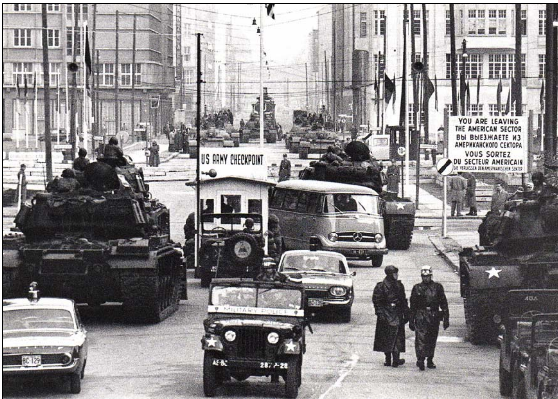
Check Point Charlie, un lieu mythique de la Guerre froide