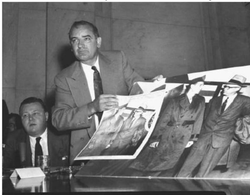
Le Sénateur McCarthy lors d'une commission d'enquête

Ainsi, après la mort de Staline en 1953, il décide de tenter une normalisation des rapports avec l'Union soviétique tout en restant vigilant à son égard; par exemple, après le succès spatial de celle-ci qui met en orbite un satellite en 1957 (c'est le fameux sputnik !), il obtient du Congrès des crédits pour l'instruction publique et la recherche, afin que la science américaine ne soit pas dépassée par celle de l'URSS. Et surtout, il va mettre fin aux excès du maccarthysme. Aveuglé par sa puissance, McCarthy commet en effet l'erreur de s'attaquer à l'armée. Le Président encourage alors le Pentagone, puis le Sénat à réagir contre cet accusateur téméraire. Sommé de s'expliquer sur les pressions qu'il aurait exercées pour faire réserver un traitement privilégié à l'un de ses protégés, MacCarthy est discrédité devant l'opinion publique. Blâmé par le Sénat, il sombre dans l'alcoolisme, et meurt deux ans plus tard, en 1957, déjà oublié.